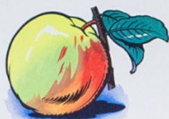
u ne po mme mû re