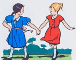
a line a une a mie ma rie