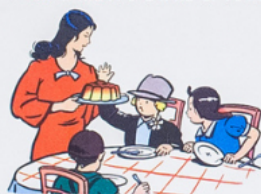
mè re a mè ne le re pas