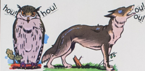
hou! dit le hi bou