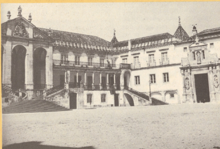
H. Roger Viollet

Cela est particulièrement vrai dans le secteur pré-scolaire. Jusqu'en 1978, l'Etat n'avait aucune maternelle. Depuis cette date il a commencé à en ouvrir spécialement là où il n'existait rien mais il est loin d'avoir pu quadriller le pays.