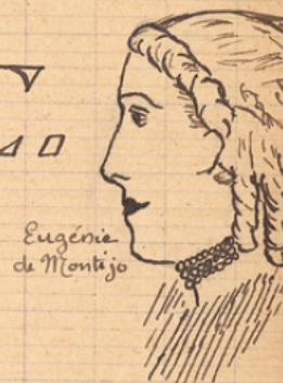
Eugénie de Montijo