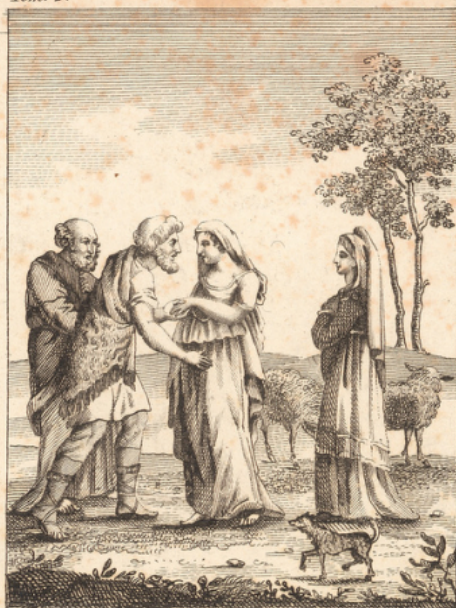
Jacob demande Rachel, et Laban le trompe.