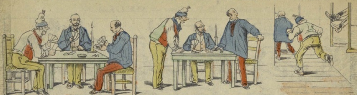
PLANCHE N° 160

Un dimanche soir, le père Francis invita deux voisins pour faire une partie de cartes.