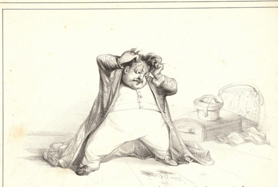
Il s'arrache les cheveux pour avoir oublié d'emporter les diamants de la Couronne