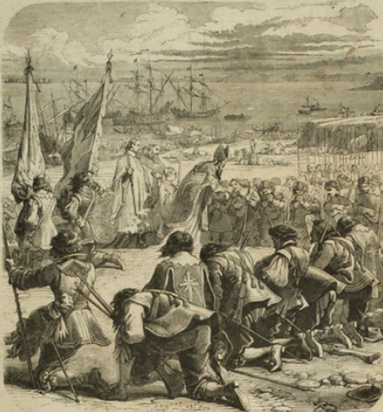
Les Français communient avant de combattre.

Maréchal de France en 1625, Schomberg chassa les Anglais de l'île de Ré, servit avec gloire au siège de la Rochelle, puis dans la guerre contre la Savoie, et mourut en 1632, après avoir vaincu Montmorency.