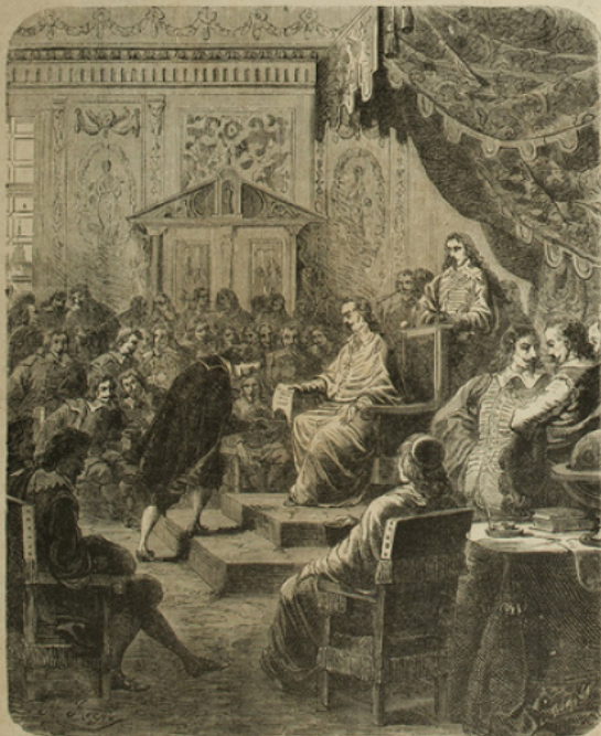
Installation de l'Académie française par Richelieu.

Richelieu avait lui-même une espèce de premier ministre : c'était un espagnol, appelé le père Joseph, et surnommé l'Éminence grise. Très instruit et très habile, le moine rendit de grands services à la France.