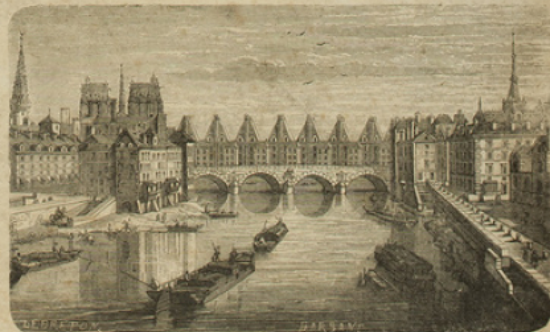
Le Pont Saint-Michel sous Louis XIII.

Le Jardin des Plantes, destiné à l'instruction des étudiants en médecine, fut fondé sous la direction de Richelieu par un des médecins de Louis XIII, Guy de La Brossse, qui donna généreusement le terrain nécessaire (1626) ; on y réunit un grand nombre de plantes rares et l'on y institua des cours publics (1640).