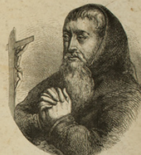
Le Père Joseph.

L'activité de Richelieu n'est pas tout entière employée à l'abaissement des grands, des protestants et de l'aristocratie. Il ramène l'économie dans les finances, seconde le développement du commerce et de la richesse publique, commence à organiser une marine de guerre, enfin favorise les sciences par la création du Jardin des Plantes (1626), et les lettres par la fondation de l'Académie Française (1635).