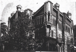
La Casa Vicens (1883-1888)

Su actividad coincidió con el nacimiento de una nueva corriente artística llamada modernismo en España que se desarrolló gracias a la aparición de una burguesía que quería invertir su riqueza en todo tipo de artes, y con la Exposición Universal que tuvo lugar en Barcelona en 1888.