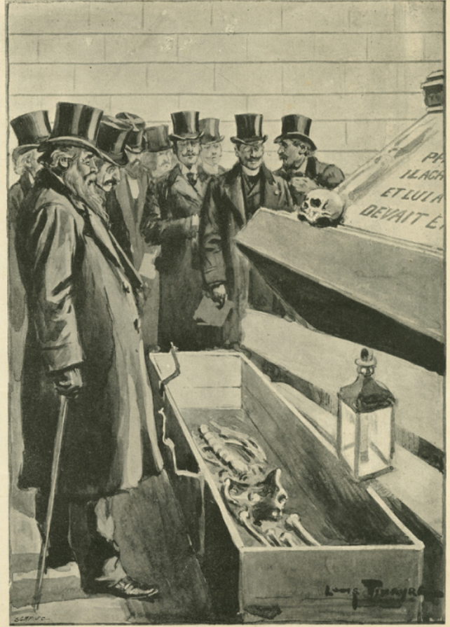
TOMBEAU DE VOLTAIRE.