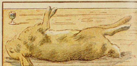
6. La moitié d'un petit verre d'absinthe produit l'épilepsie et la mort chez le lapin.