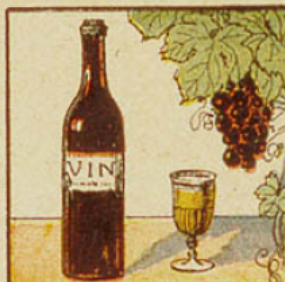
3. Un litre de vin équivaut à ce plein verre d'eau-de-vie, qui a le cinquième de sa capacité.