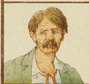
12. L'alcool défigure et dégrade celui qui en use.