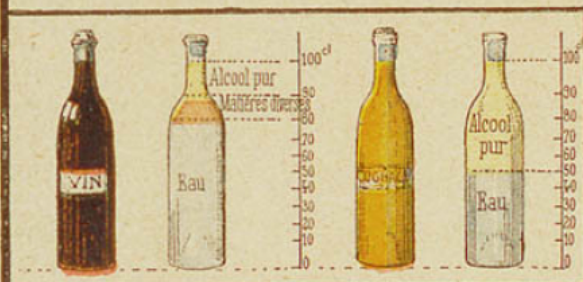
1. Le vin contient en moyenne 10 0/0 d'alcool; certains vins sont plus forts.