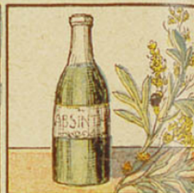
4. L'absinthe est doublement nuisible, par l'alcool et par l'essence qu'elle renferme.