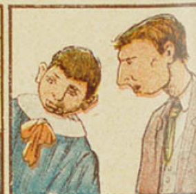
14. Les 3/4 des dégénérés, crétins, idiots, rachitiques, sont des fils d'alcooliques.

Qu'elle vante dédo très on se cueil le vi les s