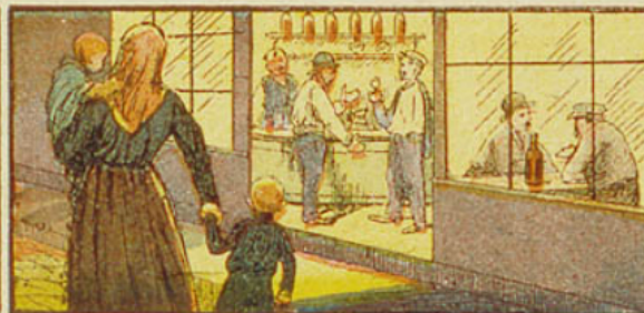
13. L'alcool fait négliger les devoirs de famille; il rend mauvais père, mauvais mari ou mauvais fils.