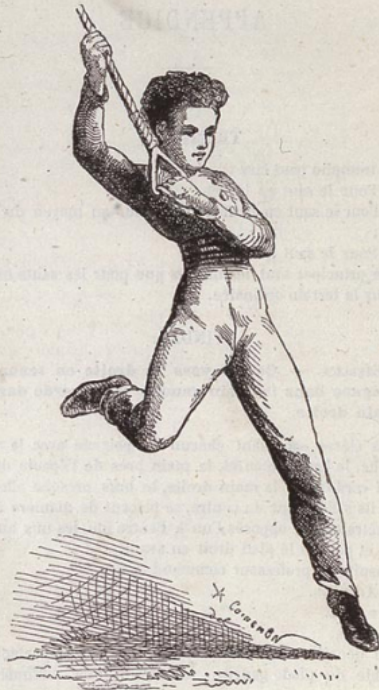
1 er Exercice.

aussi grande que possible, la face du corps en avant et parallèle à la direction de la corde.