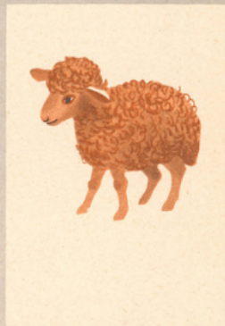
L'âlène et ses amis