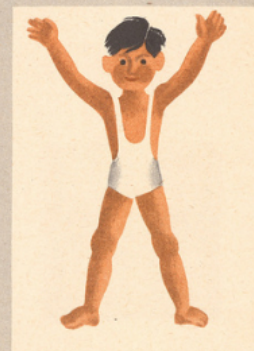
L'âlène et ses amis