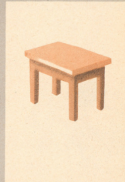
L'âlène et ses amis