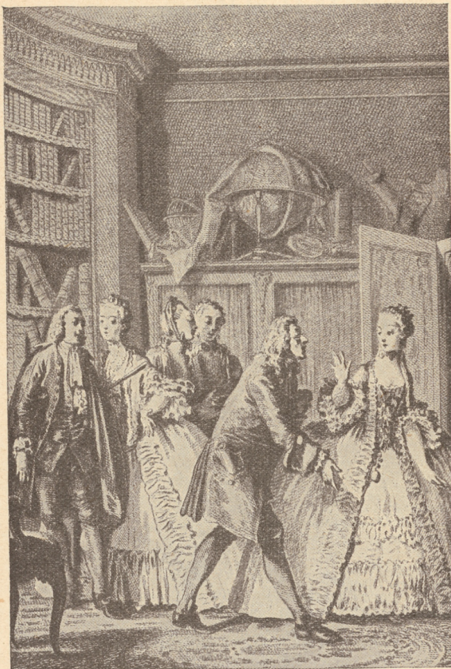
Dessin de J.-M. Moreau le Jeune, pour l'édition du Théâtre de Molière , 1773.