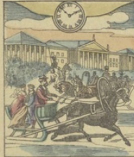
Il est Une heure 52 min. du soir à S.-PÉTERSBOURG (Russie) La Perspective Neusky