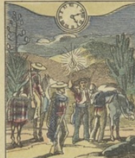
Il est Cinq heures 14 m. du matin à MEXICO (Mexique) Le départ des Muletiers