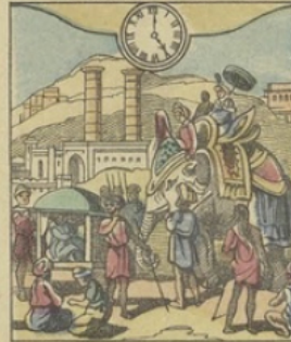
Il est Cinq heures du soir à DELHI (Indes Anglaises) Vue de Delhi, (ancienne capitale du Grand Mogol)