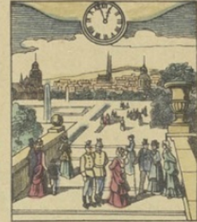
Il est Midi 56 minutes à VIENNE (Autriche) La célèbre promenade du Prater