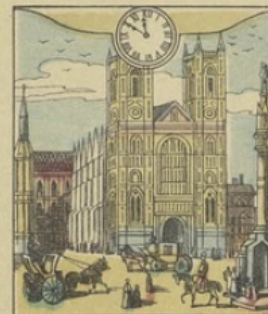
Il est Onze heures 50 m. du matin à LONDRES (Angleterre) Une rue de Londres près de Westminster