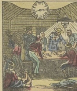
Il est Trois heures 41 m. du matin à SAN-FRANCISCO (Californie) Maison de jeu chez les chercheurs d'or