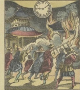
Il est Neuf heures 10 m. du soir à YOKOHAMA (Japon) Un incendie dans le quartier européen