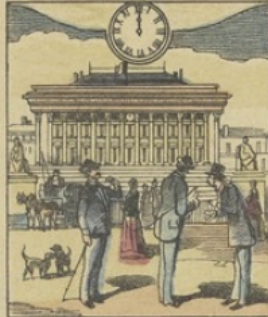
Quand il est MIDI à PARIS (France) : Vue de la Place de la Bourse