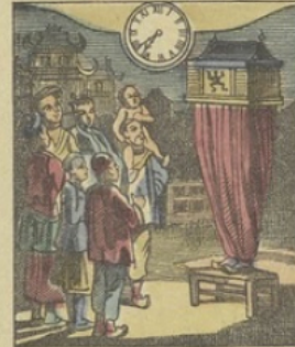
Il est Sept heures 37 m. du soir à PÉKIN (Chine) L'Homme Lanterne-Magique