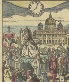
Il est Midi 40 minutes à ROME (Italie) Procession papale sur la Place St-Pierre