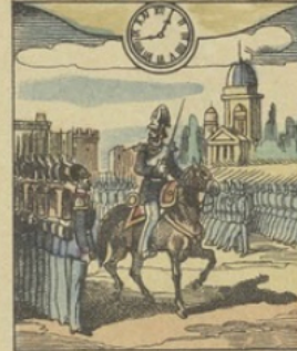
Il est Midi 44 minutes à BERLIN (Allemagne) Une Revue sur la Place Royale