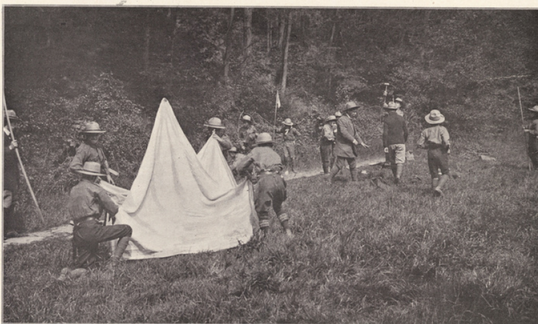
LES ÉLÈVES ÉCLAIREURS. — Sur le terrain de campement, après un exercice topographique : on dresse la tente et on va préparer le repas.

Faire vivre par l'adolescent ce qui l'attire dans les livres d'aventure, orienter ses jeux en en faisant un moyen de discipline morale, l'habituer à vivre en plein air, développer chez les jeunes l'ingéniosité pratique, l'esprit du sacrifice, la gaieté dans l'effort, c'est évidemment et très adroitement apprendre aux enfants à travailler pour eux-mêmes, pour notre race et pour notre pays.