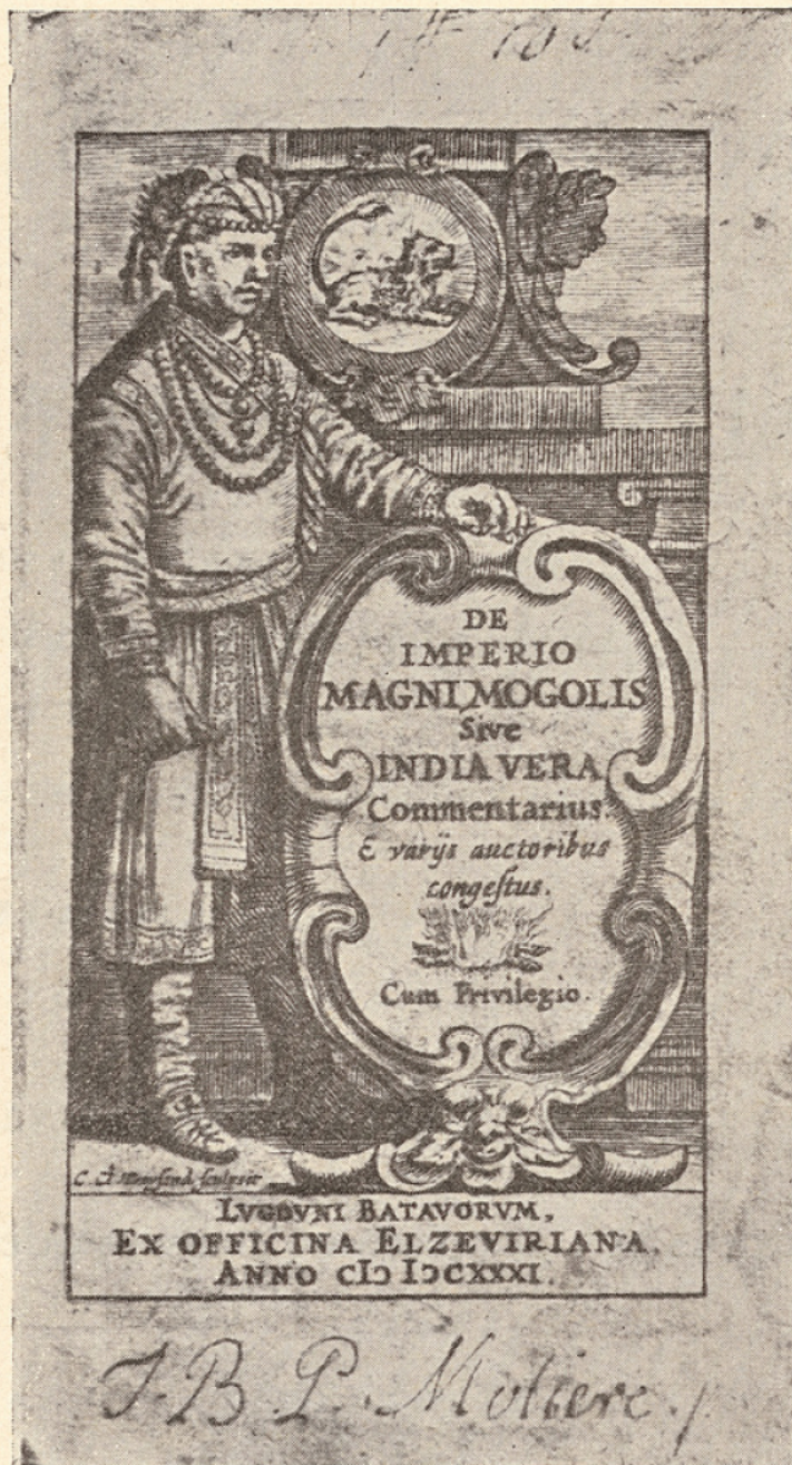
1. Signature autographe de Molière.