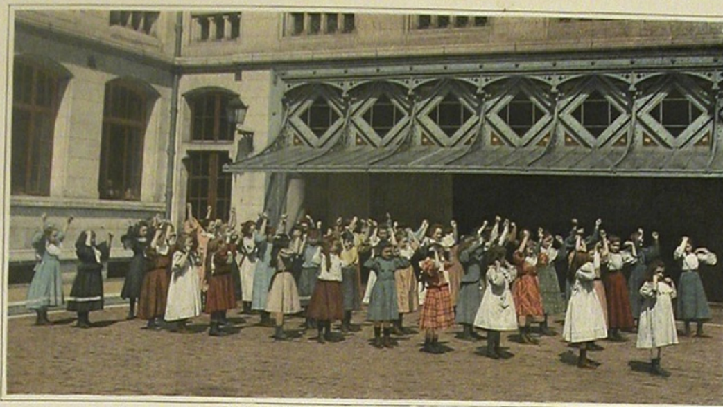
EXERCICES GYMNASTIQUES DES PETITES, AU LYCÉE RACINE, RUE DU RÔCHER.