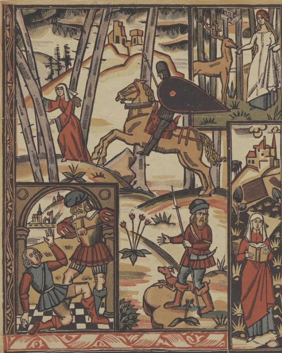
TOLMER, Grav. Paris