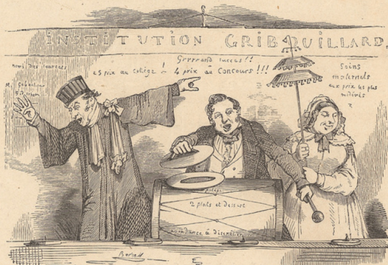
Comment M. Gribouillard se dispose à répandre les bienfaits de l'enseignement.