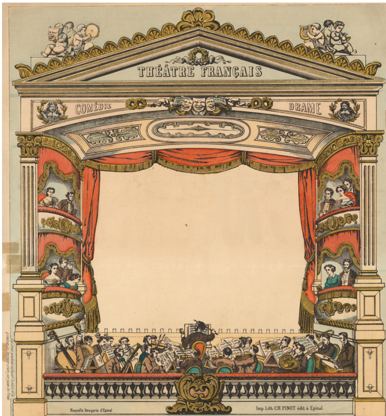
NOUVEAU THÉÂTRE PORTATIF A RAINURES Pouvant se monter et se démonter instantanément.