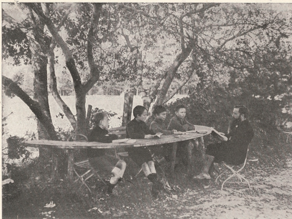
Leçon en plein air