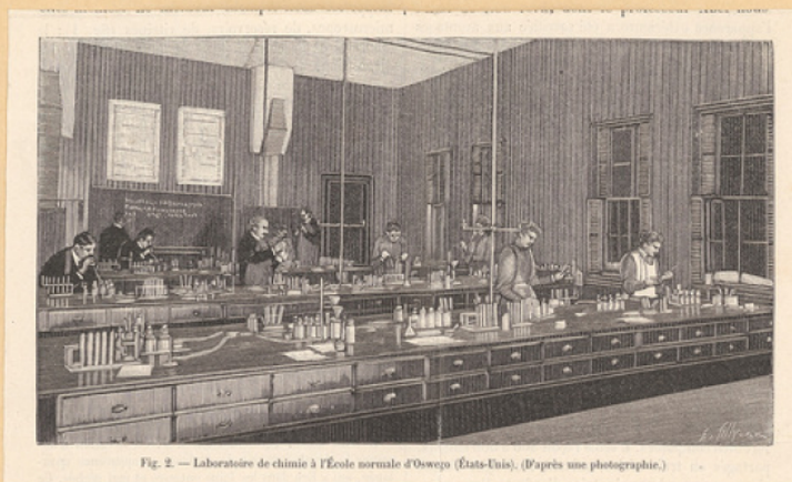
Fig. 2. — Laboratoire de chimie à l'École normale d'Oswego (États-Unis). (D'après une photographie.)