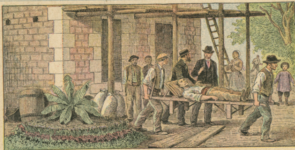
N° 4. — LES ACCIDENTS DU TRAVAIL.

L'assurance a pris un développement considérable : cela tient à l'évolution progressive de la civilisation, encourageant les esprits à s'affranchir de plus en plus des fléaux qui ravagent l'humanité. L'assurance sur la vie est de celles qui sont les plus indispensables. L'homme qui travaille est un capital, une valeur susceptible de revenus, mais périssable. Sa vie peut donc faire l'objet d'une assurance pour diminuer le préjudice matériel qu'entraîne la mort. Des compagnies ont été créées dans ce but. L'assuré verse une prime annuelle, et la compagnie garantit à ses héritiers un capital en cas de décès ER. RICHAR.