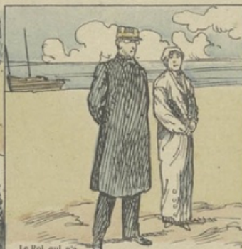
Le Roi, qui n'a jamais cessé de diriger les combattants, et la Reine, qui n'a jamais cessé de les assister: sur le rivage du lambeau de territoire, au sud de l'Yser, qui est demeuré inviolé.