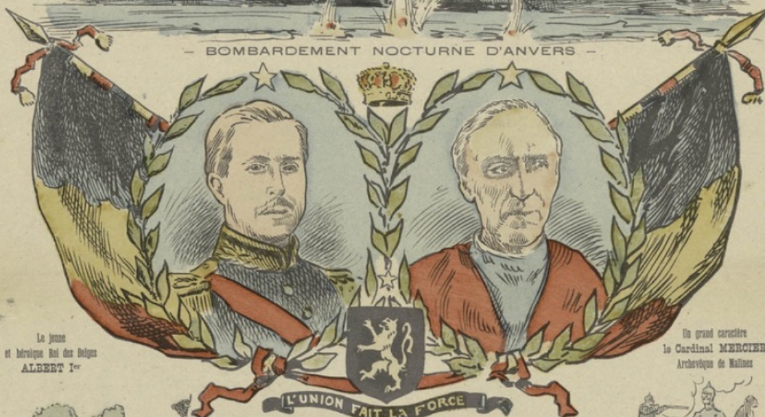
Le jeune et héroïque Roi des Belges ALBERT I er