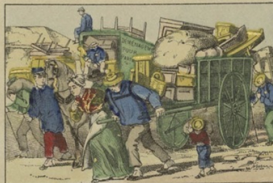
Les gens de la banlieue rentrant dans Paris.