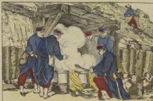
La cuisine dans les casernes.