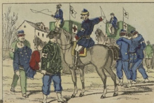
Les ambulances de la presse.