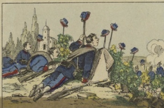
Ruses des mobiles à Argenteuil.