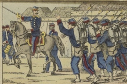
Les gardes mobiles partant pour les avant-postes.