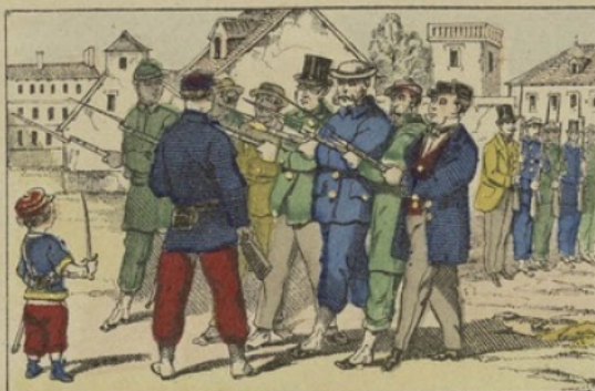
Les gardes nationaux faisant l'exercice.