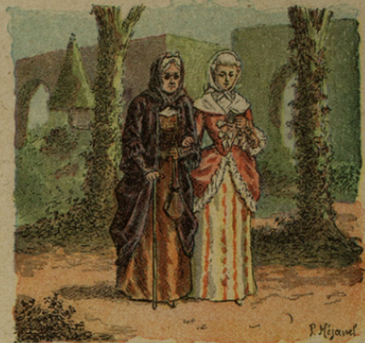
MADAME DU DEFFANT (1697-1780).

Helléniste et latiniste distinguée. Son père ayant admis le jeune Dacier, encore enfant, à partager les leçons de sa fille, il arriva que les deux élèves apprirent à s'estimer et à s'aimer jusqu'au jour où, devenus majeurs, ils consacrèrent par une union solide l'affection de leur enfance. Madame Dacier, femme savante d'un haut mérite, acquit une renommée européenne par ses traductions des auteurs anciens.