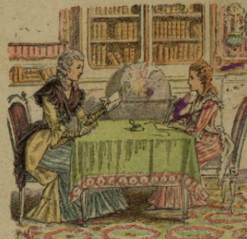
MADAME CAMPAN (1752-1822).

Madame Geoffrin avait un esprit remarquable. Aussi recevait-elle dans son salon toutes les sommités de son temps. Deux diners par semaine réunissaient alternativement les gens de lettres et les artistes : le mercredi était le jour des littérateurs, des poètes et des philosophes. Les invités recevaient invariablement une calotte de velours. Diderot, La Harpe, d'Alembert et Marmontel étaient les familiers de la maison.