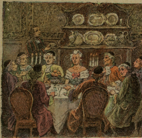
MADAME GEOFFRIN (1699-1777).

Madame du Deffant était une femme instruite et spirituelle, ayant tous les défauts et les qualités de son siècle. Le cœur lui manque, mais quelle rare intelligence, quel esprit à la fois solide et brillant! Voltaire fut son ami. Sa correspondance, étincelante de malice et de verve, remplie d'anecdotes du temps, constitue un tableau plein de franchise. Devenue aveugle, M lle de Lespinasse fut sa lectrice.