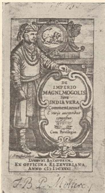
1. Signature autographe de Molière.