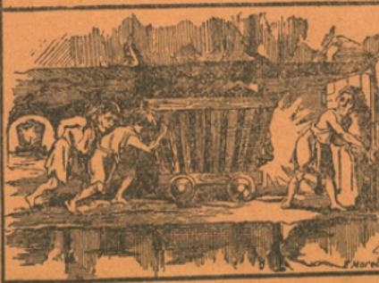
LES GALERIES DE MINE