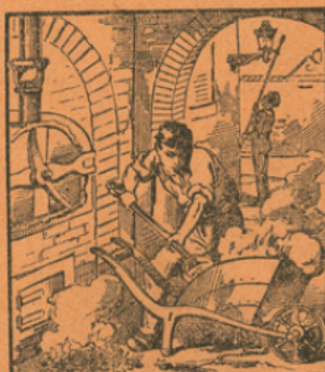
USINE A GAZ

Extrait de l'Imagerie des connaissances utiles par Ad. LINDEN