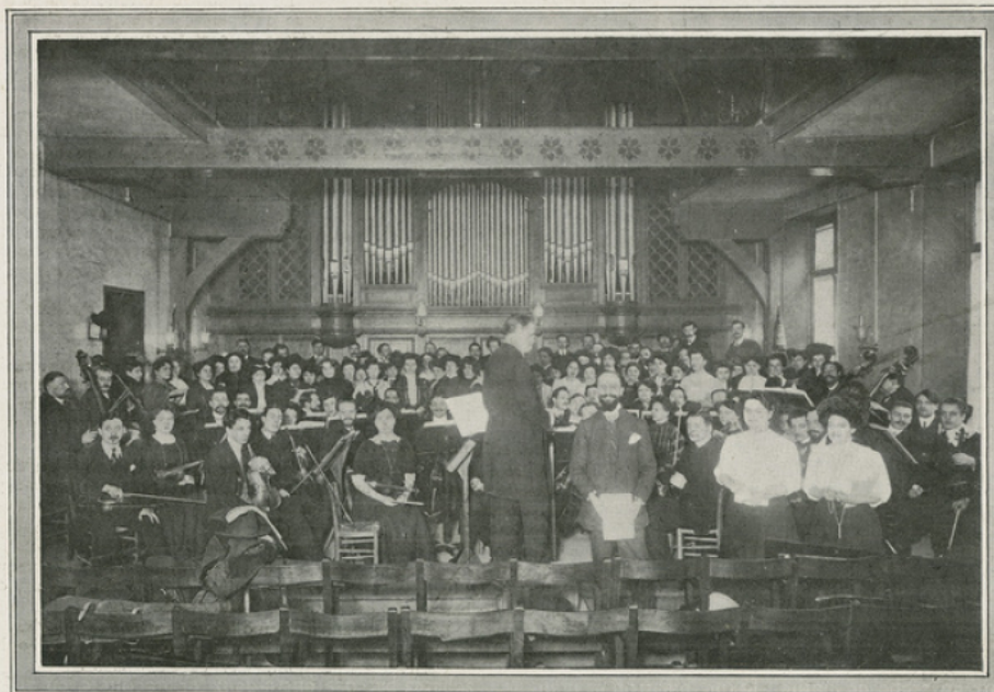
Une répétition à la "Schola Cantorum", dirigée par M. Vincent d'Indy.