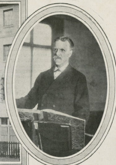
M. Vincent d'Indy, un des fondateurs et directeur actuel de la "Schola"

Il convient de faire l'éloge de l'émulation. C'est grâce à elle que les jeunes hommes, aux heures où le travail pèse sur leurs épaules comme le plus lourd des fardeaux, reprennent courage et luttent avec une nouvelle vaillance ; c'est aussi à son pouvoir occulte, ainsi qu'à celui de la concurrence, que nous devons les progrès les moins contestables de la civilisation moderne.