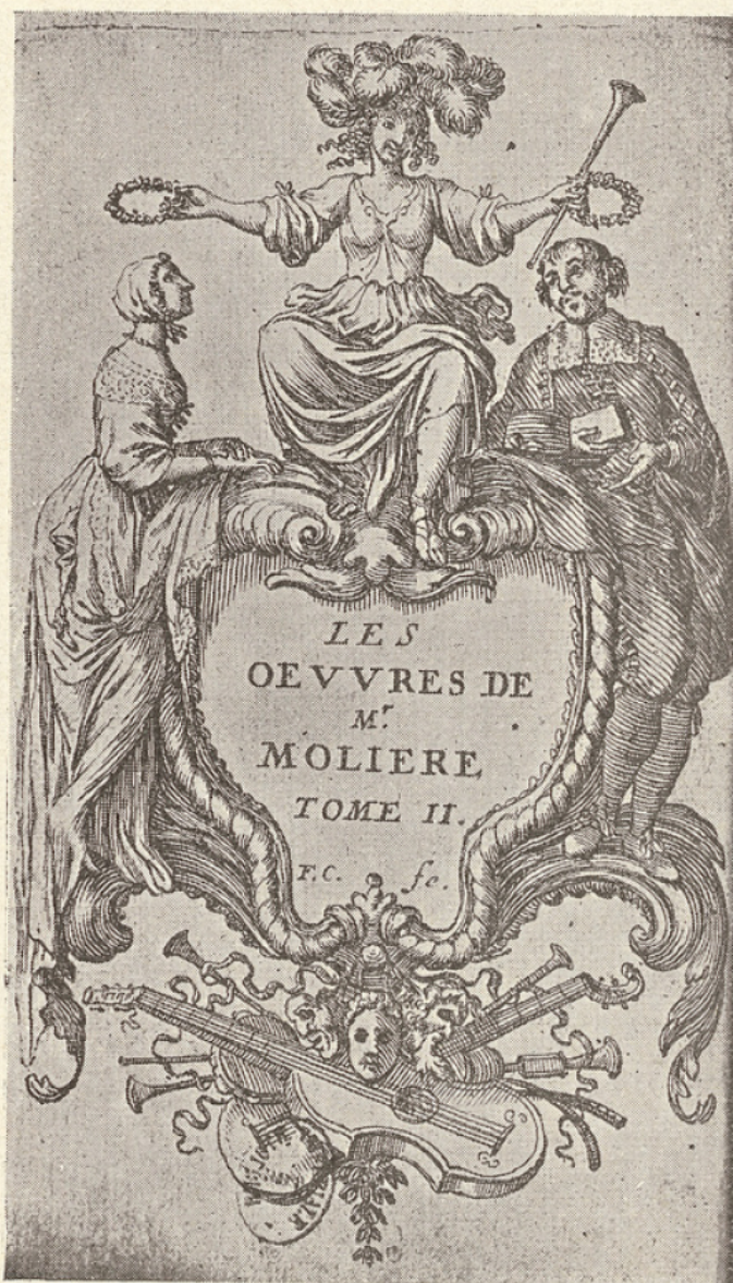
1. Molière dans un rôle de bourgeois (d'après F. Chauveau).

On n'a pas de document contemporain représentant Molière dans Chrysale; mais le costume de Molière dans le rôle d'Arnolphe peut sans doute donner quelque idée de son costume dans les rôles bourgeois. D'ailleurs le costume de Chrysale était ainsi composé : « justaucorps et haut-de-chausses de velours noir, veste de gaze violette et or garnie de boutons, un cordon d'or, jarretières, aiguillettes et gants ».