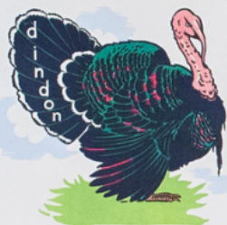
un din don