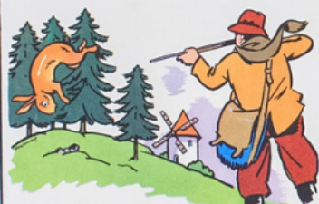
an to nin a tu é ja no! la pin