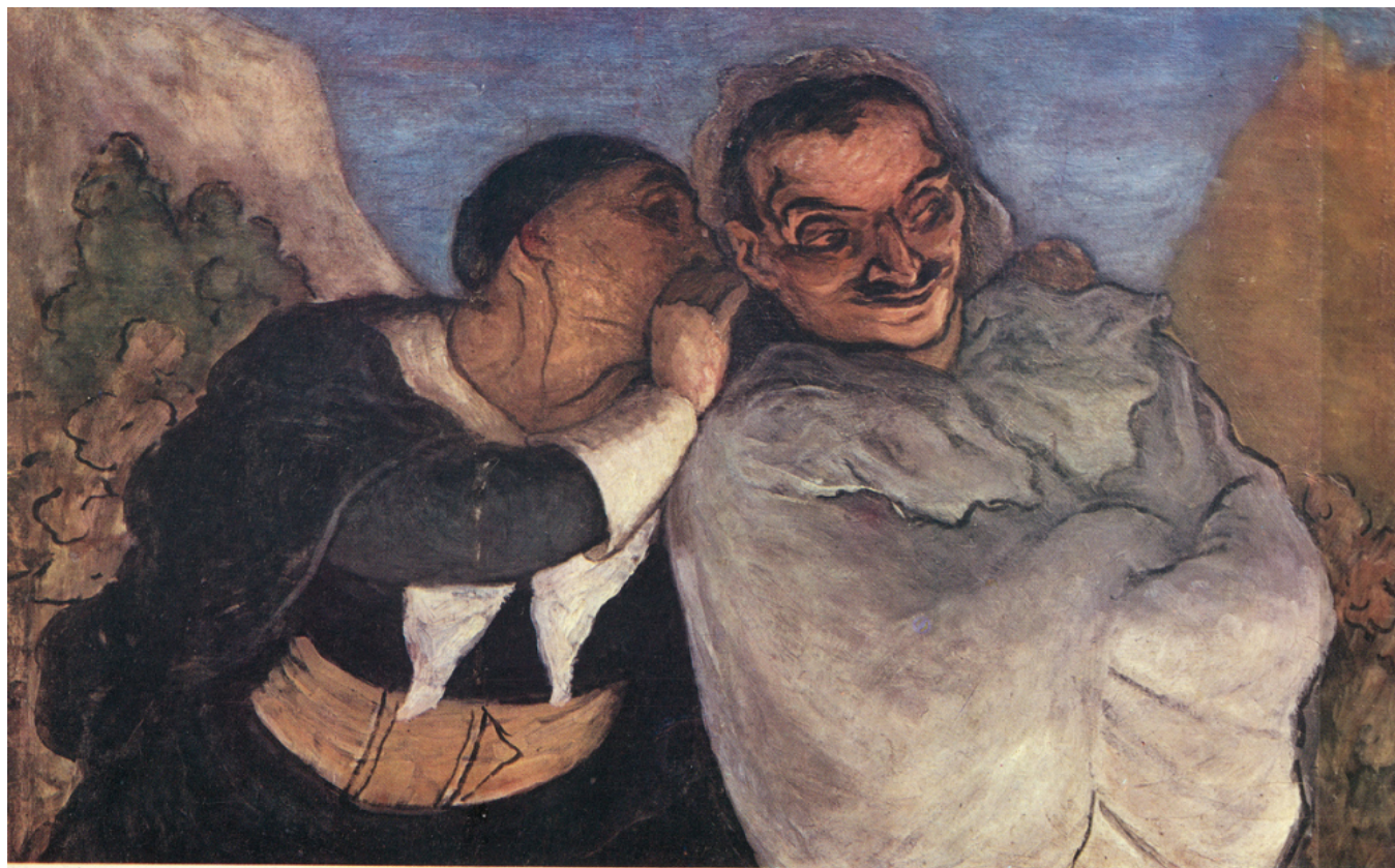
Honoré Daumier : Crispin et Scapin, Louvre, Paris.

Il était trois bouffons Sur un char à cochons, Et trille, trille, trille, trille! trilala.