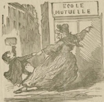
UN JEUNE CITOYEN QUI EST DANS SON DROIT. — Je ne veux pas aller à l'école... la loi sur l'instruction publique n'est pas encore votée... je veux une garantie du gouvernement, moi, na!