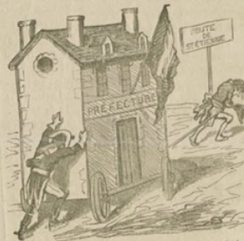
Translation de Montbrison à Saint-Etienne de l'hôtel de la préfecture du département de la Loire.