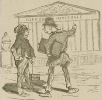
L'OPINION DE FOUYOU. — Avec leur loi sur l'instruction publique... ils feraient bien mieux de nous laisser tranquilles... on sait encore mieux se tenir dans notre classe que dans la leur!...