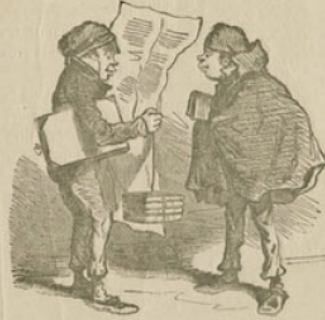
— De quoi, D'après, v'la les socialistes qui se mêlent à la discussion sur l'instruction publique. — Eh bien, qui ne ça t'fait? — Tiens, y sont capables de mettre dans cette loi-là le droit au travail... c'est ça qui serait embêtant!