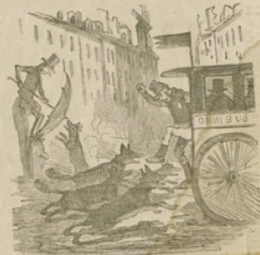
Aspect qu'auront les rues de Paris la semaine prochaine, si le froid continue.