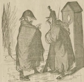
— Facionnaire, surveillez donc mieux que cela!... vous avez laissé prendre tous les bassins des Tuileries... et voilà que votre nez lui-même est sur le point d'être pris... Je serai obligé de vous mettre à la salle de police pour votre négligence!