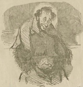
Un membre de l'assemblée nationale ayant l'ingénieuse idée de se dégriser les doigts en les fourrant dans un manchon donné par la nature.