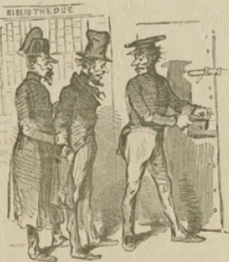
LA BIBLIOTHÈQUE CARLIER. — Excusez, je vous ai r'liché ce matin et vous vous faites repincer ce soir! — D'na! j'avais commencé ici la lecture d'un livre fort intéressant, et j'me suis fait remettre en prison pour avoir le temps de le finir.