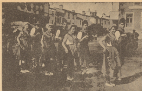
Danseurs du groupe folklorique du Boulou (P.-O.)