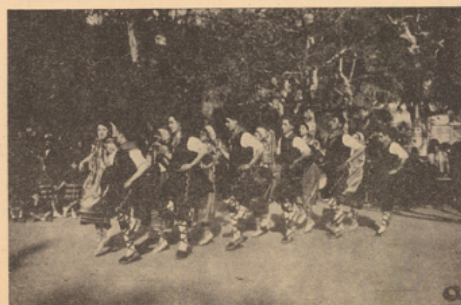
Garçon et fille se donnent la main. Chacun tient l'extrémité de la diagonale d'un foulard enroulé autour de l'index (photo a)