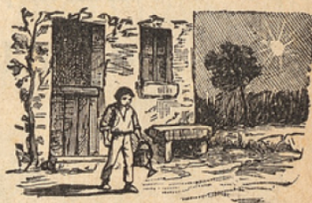
FIGURE 1. — Le soleil se lève et Paul est déjà debout.

1 Le soleil vient de se lever, et 2 la rosée du matin brille encore sur les fleurs.