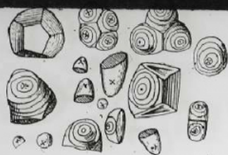
Grains de Fécula de la Patate. Grossiss. 200.