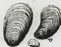
Hile ou Vacuole, Grossiss. 350.