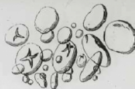
Grains de Fécula de Seigle. Grossiss. 200 fois.