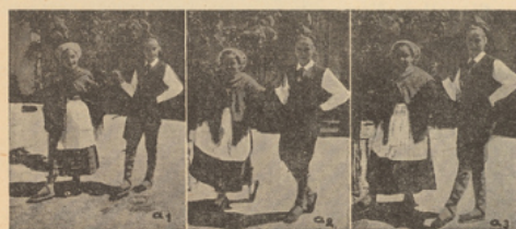
Détails du pas

Quatrième figure : comme deuxième. La fille finit en B, le garçon en D.