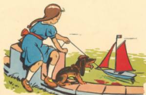
oline ti re son ba teau