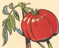
oline va manger de la to ma te