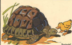
la tor tue d'oline