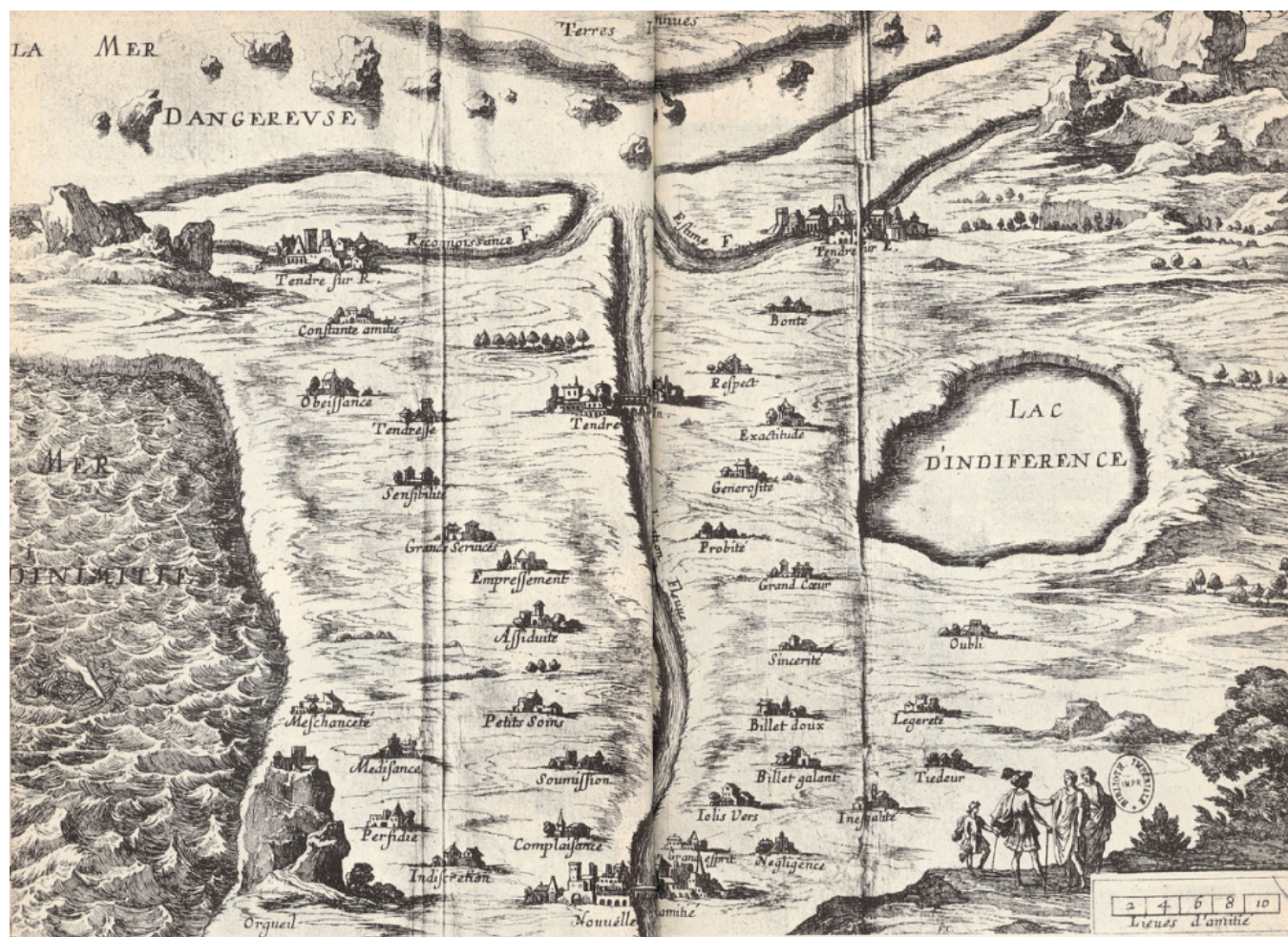
Carte de Tendre ou comment aller « de Nouvelle-Amitié à Tendre »,

extraite du t. I de Clélie de Mlle de Scudéry, 1654.