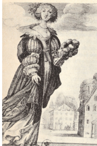
Précieuses et précieux (gravures d'Abraham Bosse).