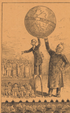
CRISPI AIDANT BISMARCK À SOUTENIR LE MONDE Reproduction d'une caricature italienne du Fischio