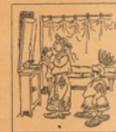
Crispi met ses courses de nuit Vignette de Don Quichotte .