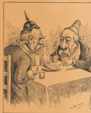
APRÈS LES JOURS GRAS Reproduction d'une caricature de Gilbert-Martin, dans le Don Quichotte .

Ce nouveau volume, de l'auteur des grands ouvrages sur les Mœurs et la Caricature, est, en quelque sorte, une suite au Bismarck raconté par l'image qui obtint l'année dernière, un succès si considérable. C'est le second volume d'une grande collection qui doit faire défiler sous les yeux du public toutes les figures historiques du passé et du présent.