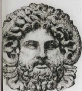
Tête de Jupiter Ammon. d'après une sculpture antique.