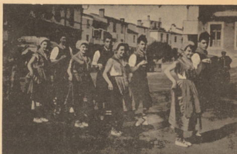
Danseurs du groupe folklorique du Boulou (P.-O.)