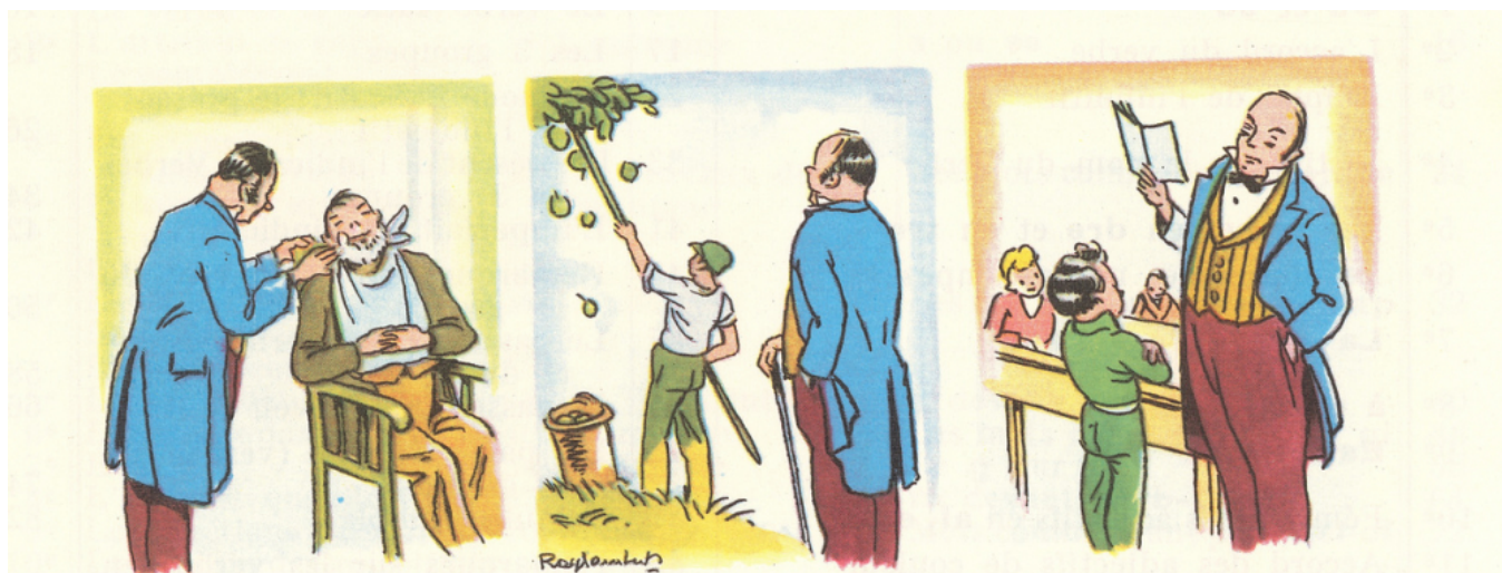
Un instituteur d'autrefois.