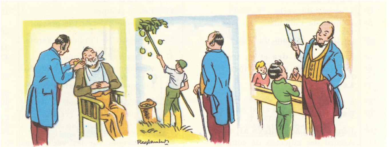
Un instituteur d'autrefois.