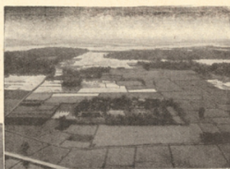
TONKIN Vue panoramique de la région de Kien An