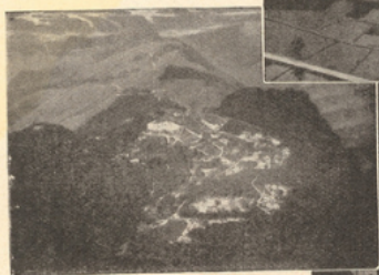
TONKIN Tam Dao : Vue générale