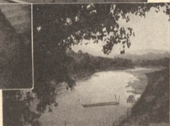
LAOS Luang Prabang : Les bords du Nam Khan