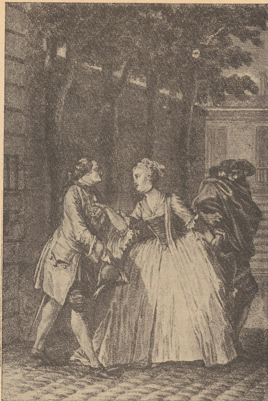
Dessin de Moreau le Jeune pour l'édition du Théâtre de Molière ; Paris, 1773.