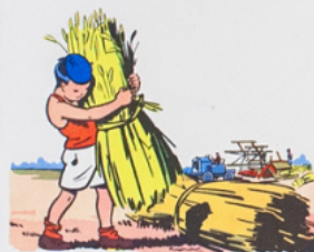
la moi sson