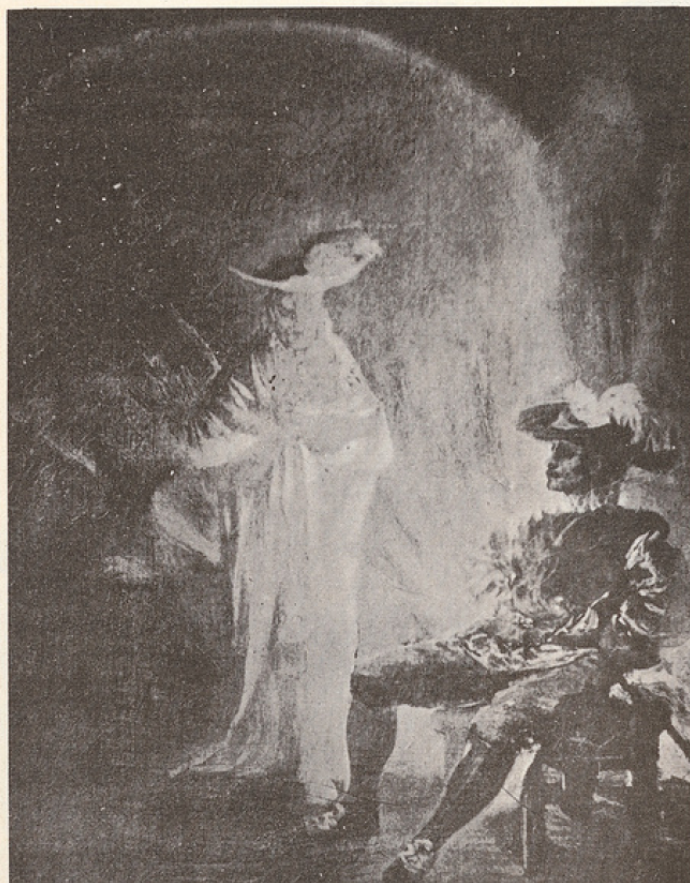
Goya : Don Juan et le Commandeur . Collection de Osuna.