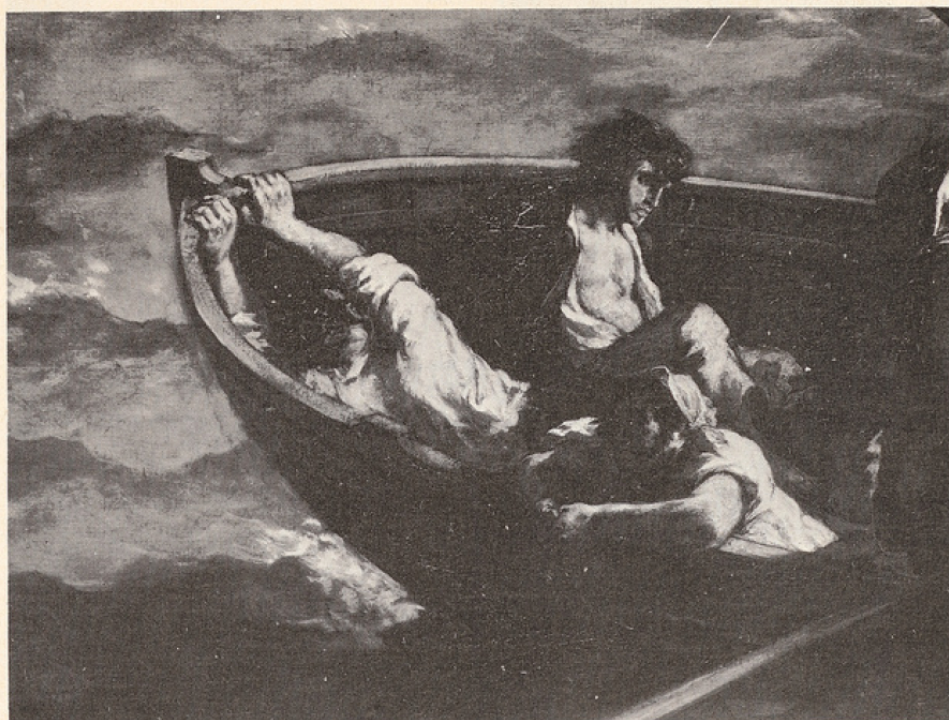
Delacroix : Le Naufrage de Don Juan (détail). Musée du Louvre.