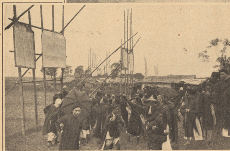
LES EXAMENS DE MANDARINAT

Grands dignitaires de la cour de Hué, présidents et vice-présidents des examens. Après les corrections des premières épreuves achevées, les concurrents viennent prendre connaissance, sur des affiches, des noms de ceux qui sont admis à poursuivre les examens.