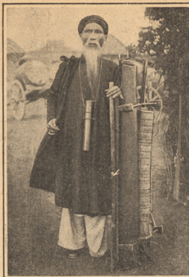
Un bachelier, candidat à la licence, muni de tous ses accessoires.

de son choix. Mais le travail des jeunes lettrés annamites leur sera considérablement facilité avant peu par l'adoption du quoc ngu , c'est-à-dire de notre alphabet. Depuis 1909 l'enseignement du quoc ngu s'est répandu dans toute l'Indo-Chine avec une incroyable rapidité et de nombreux ouvrages de vulgarisation ont été imprimés avec les nouveaux caractères. Un lettré annamite distin-