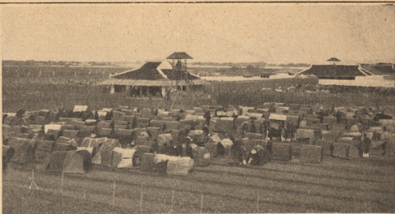
Vue du camp des lettrés et des tentes-abris.

de son choix. Mais le travail des jeunes lettrés annamites leur sera considérablement facilité avant peu par l'adoption du quoc ngu , c'est-à-dire de notre alphabet. Depuis 1909 l'enseignement du quoc ngu s'est répandu dans toute l'Indo-Chine avec une incroyable rapidité et de nombreux ouvrages de vulgarisation ont été imprimés avec les nouveaux caractères. Un lettré annamite distin-