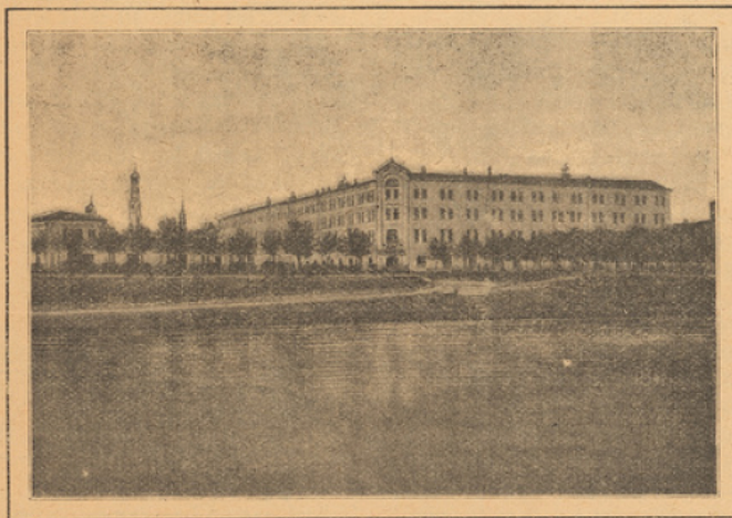
LA PENSION D'ÉTUDIANTES OU « OBCHTCHÉJITIÉ ».

L'officielle, créée auprès des cours eux-mêmes, outre sa surveillance incessante, présente l'inconvénient de ne s'adresser qu'au moins pauvres : le prix en est de 300 roubles, près de 800 francs par an. Restent celles fondées par des sociétés privées ou par la charité d'un particulier. L'étudiante ne s'y trouve pas libre et elle a le sentiment — parfois douloureux — de se sentir une assistée, une nécessaire. Malgré